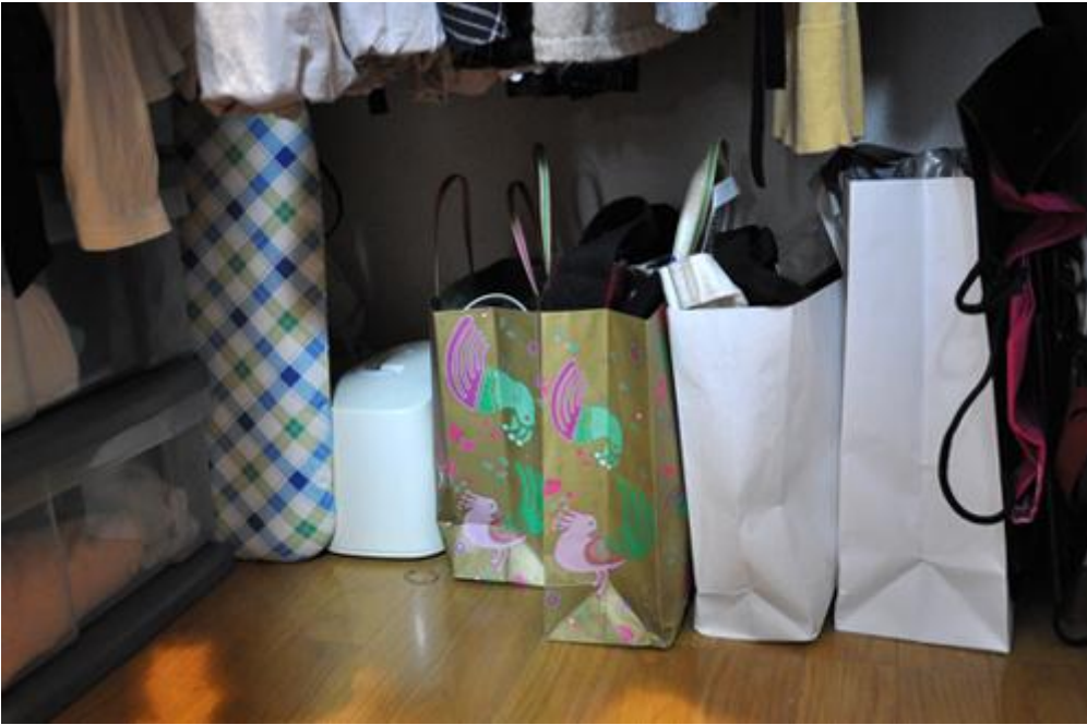
カバンはショッピングバッグに入れて床に