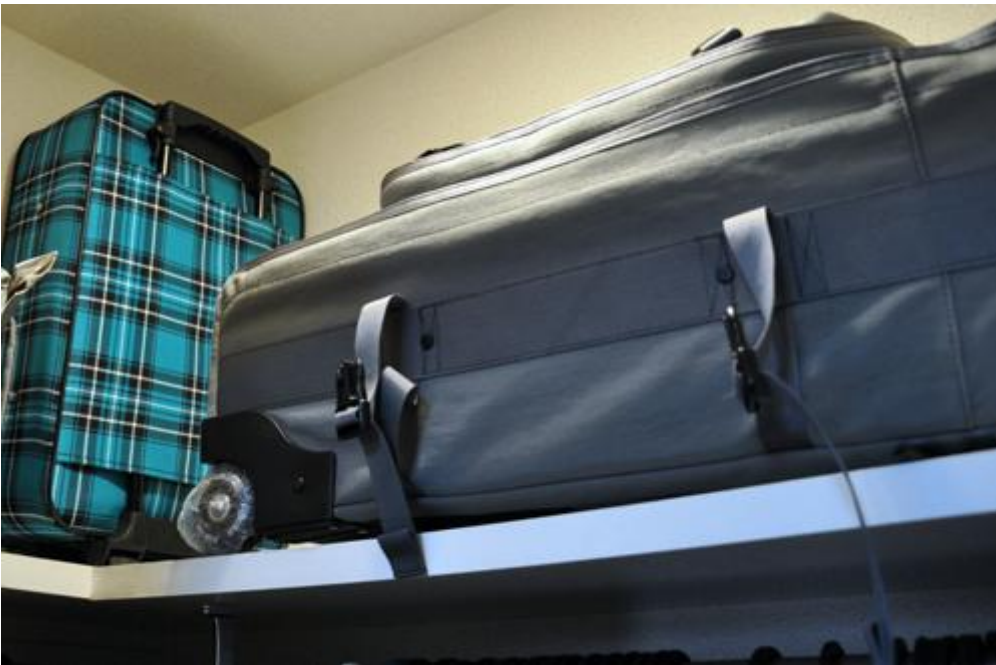
使用頻度の低い服やオフシーズンの服はスーツケースへ入れて棚の上へ