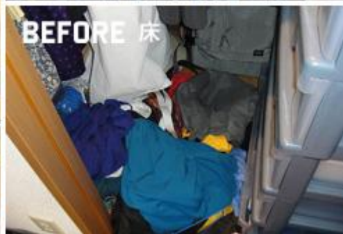
ビフォアはこちら