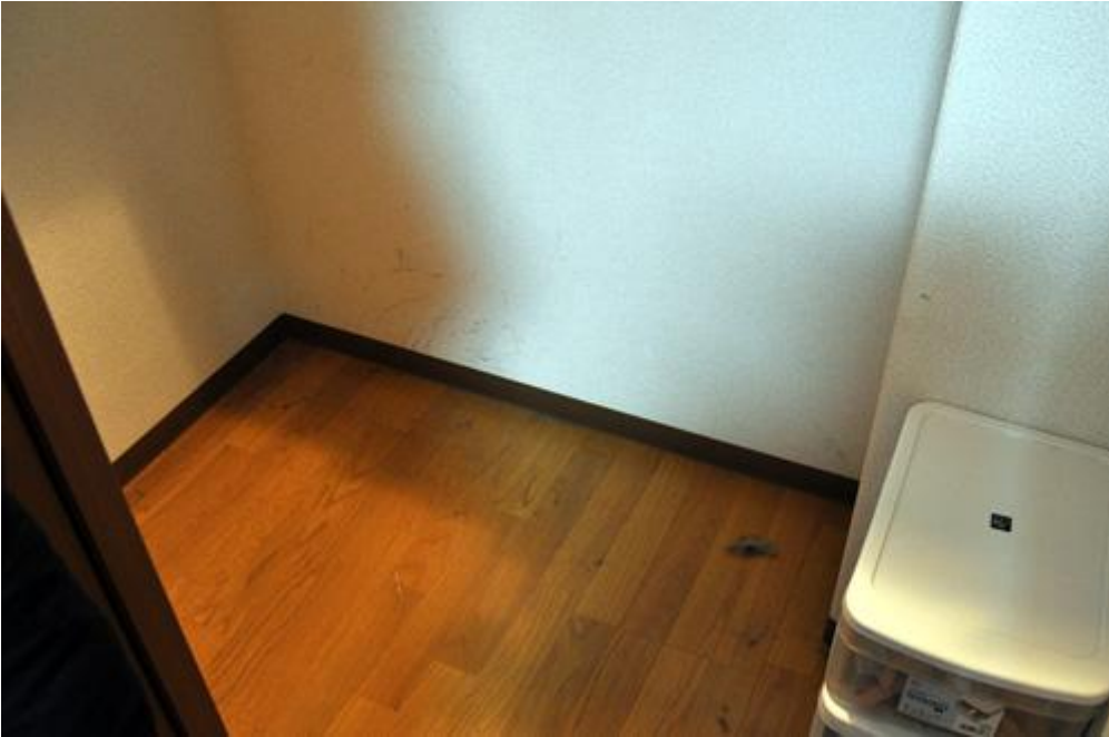
カラッポになったクローゼット

クローゼットにあったものを全て出し、まずは「必要」「保留」「不要」と3つに分類。更に「必要」なモノを、オンシーズン・オフシーズンと分けました。